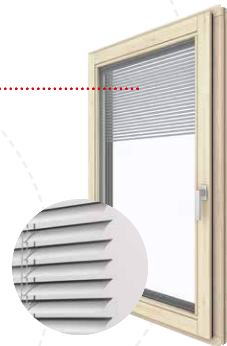
HV 350 interno abete rosso | FI501

La veneziana chiusa oscura in modo perfetto. Inoltre, inclinando le lamelle è possibile dosare esattamente la luce. In questo modo i locali sono luminosi ma si lasciano fuori il sole e il caldo eccessivi. La veneziana è quindi perfetta per i locali in cui si soggiorna.