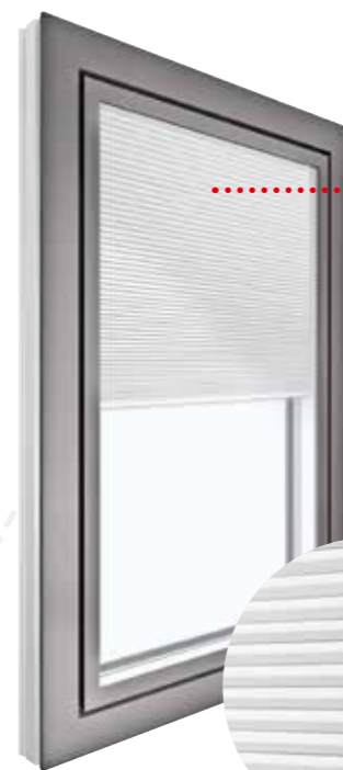
KV 350 esterno guscio in alluminio | HM907