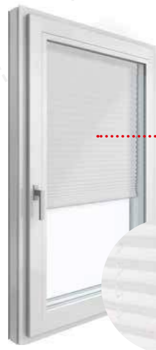
KV 440 interno PVC | PVC bianco

Il rivestimento in alluminio di questa doppia tendina plissettata non lascia pressoché entrare alcuna luce e quindi oscura in modo perfetto. Duette® vi offre però anche un'eccellente protezione dagli sguardi indiscreti e viene quindi installata spesso nel bagno o nello spogliatoio.